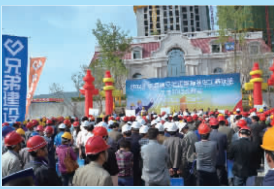
盛大的观摩会，受到西宁业界人士强烈关注。